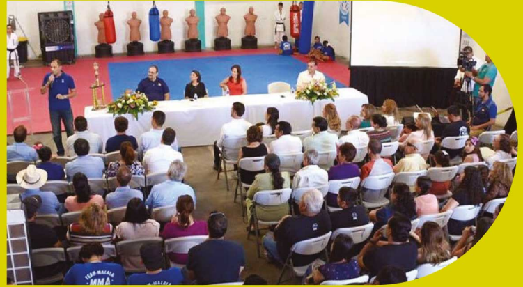
30 de abril de 2016 - Apertura de sucursal Hermosillo, en Hermosillo, Sonora.